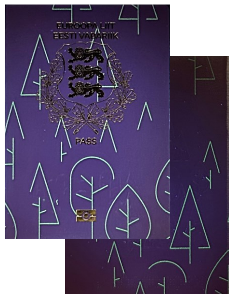
UV-trüki disain alates 16.03.2026