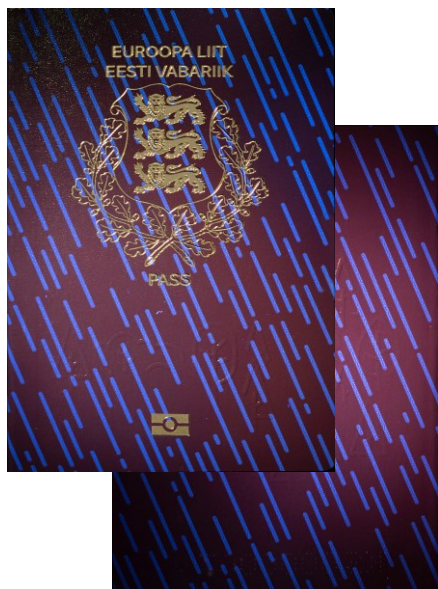
UV-trüki disain kuni 13.03.2026